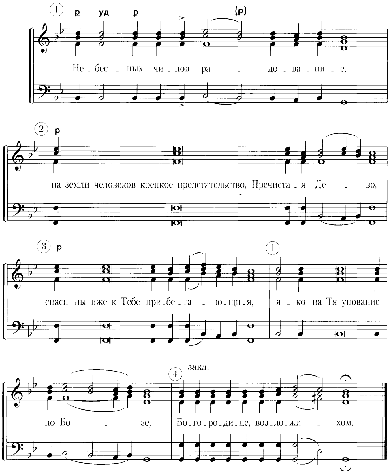
Схема распеваия по музыкальным строкам: 1, 2, 3 - чередуются, 4 - заключительная.